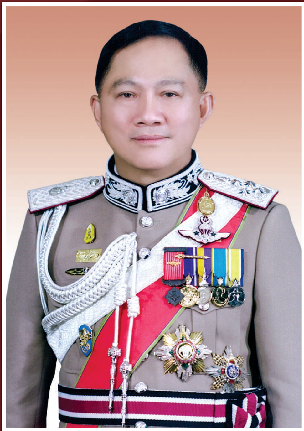
พลตำรวจเอก อุดุลย์ แสงสิงแก้ว ผู้บัญชาการตำรวจแห่งชาติ